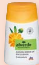
alverde Продукт за премахване на грима от очите Невен, 100 ml

Този продукт за премахване на грим е подходящ за нормална кожа като я отпуска, успокоява и се грижи за чувствителните зони на очите. Медицински доказано е, че продуктът е подходящ и за хора използващи контактни лещи.