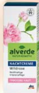
alverde Нощен крем с екстракт от диви роза 30 ml