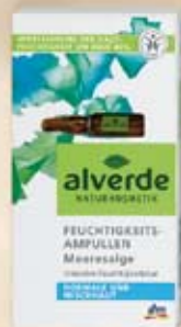
alverde Овлажняващи ампули за лице с екстракт от водорасли 5 x 1 ml