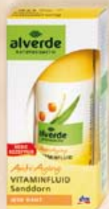
alverde Anti-Aging Флуид против бръчки с екстракт от шипка 30 ml